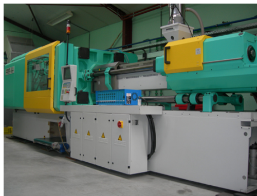
Une presse à injecter - Cojema