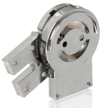
Exemple de pièce plastique réalisée par injection plastique - Cojema